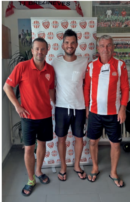
foto: fotbalisté TJ Březiněves

Výboru se líbila dlouhodobá koncepce trenéra a důraz na přístup k fotbalu, který koresponduje s naší klubovou filozofií (nominace na utkání podmíněna přítomností na trénin-