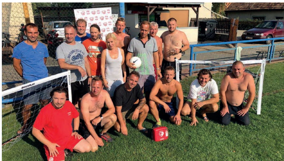
foto: fotbalisté TJ Březiněves