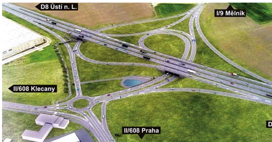
Vizualizace napojení komunikací na D8 u obce Zdíby

Koncem minulého roku se konala další ze společných schůzek zastupitelů Líbeznic, Bořanovic a městské části Praha-Březiněves, v rámci kterých se snažíme hledat cesty a opatření, jež konečně pomohou zlomit negativní trend a povedou k omezení tranzitní dopravy regionu.