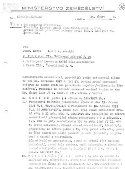
Rozhodnutí o vyvlastnění z 24. února 1948