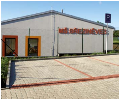
Mateřská škola v Březiněvsi

Komise školství a kultury MČ Praha-Březiněves projednala navrhovaná kritéria pro zápis do mateřské školy na školní rok 2013-2014