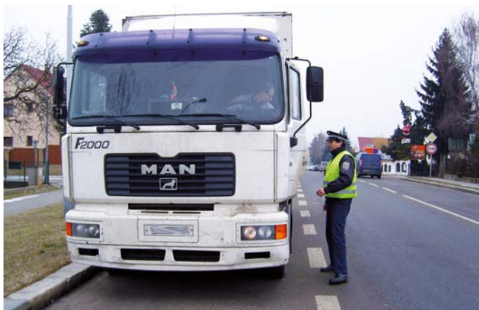
Kontrola nákladních vozidel