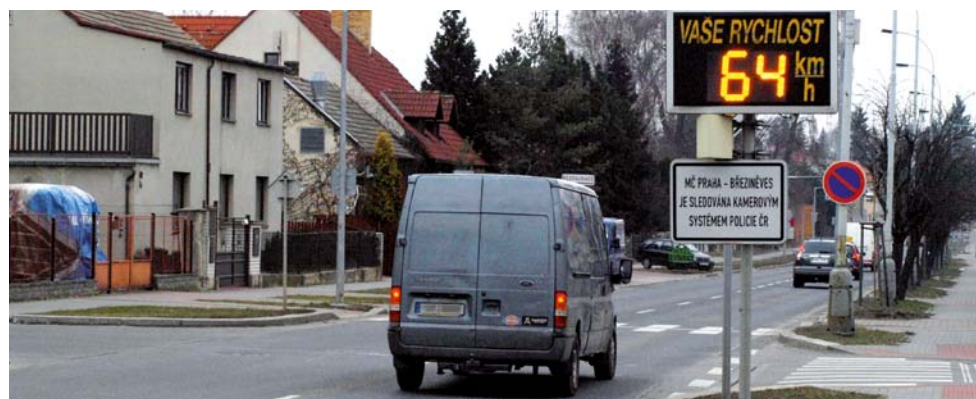
Dodávky překračující na přechodech povolenou rychlost bohužel nejsou výjimkou

Již poněkolkáté otevíráme na stránkách zpravodaje téma dopravy. Tentokrát se zaměříme hlavně na statistiky o průjezdu vozidel v období od září do prosince 2012, které máme k dispozici díky monitorovacímu zařízení instalovanému na křižovatce ulic Na Hlavní a Ke Zdibům.