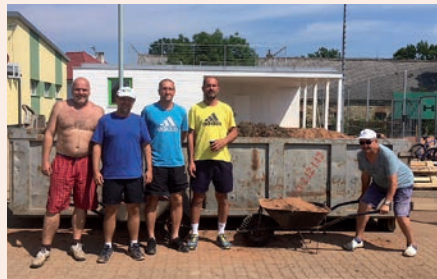
Úklidové práce po povodni

číslu a prostřednictvím webu a Facebooku. Pro ilustraci přidáváme i několik fotografií. Tenistům přejeme, aby si budovy a s tím i ob-