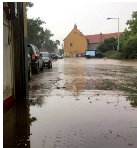
Pohled z vytopené hasičské zbrojnice

Celkem naše jednotka v tento den zasahovala u pěti událostí. Všechny tyto události byly spojeny s přivalovým deštěm. Bohužel kanálové vpusti zaneslo ve většině případů bahno z polí a tekoucí voda tak neměla kam odtéct a páchala obrovskou škodu. Nejvíce v ulici U Parku, kde zatopila dva rodinné domy a to