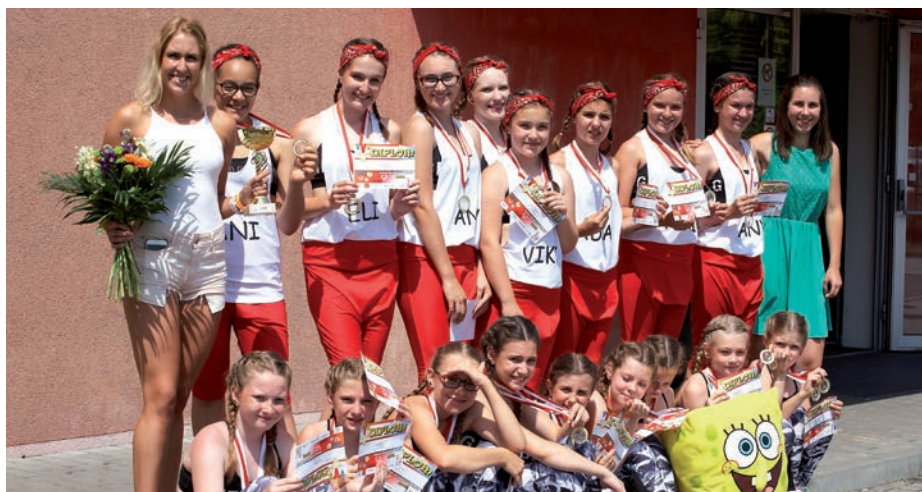
Březiněveský Zumbateam opět zcela ovládl ligovou soutěž družstev