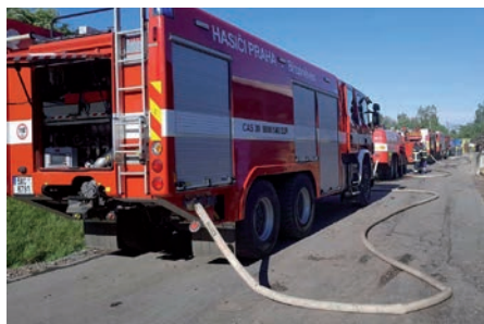
Zásah naší jednotky v pražské Hostivaři

byla naše jednotka z KOPIS HZS Praha vyslána do pražské Hostivaře na rozsáhlý požár skladu. Po pár minutách od nahlášení vyjela naše jednotka v počtu 1+5 s technikou CAS 30 Scania na místo události. Během zásahu pak na místo dorazila další část naší jed-