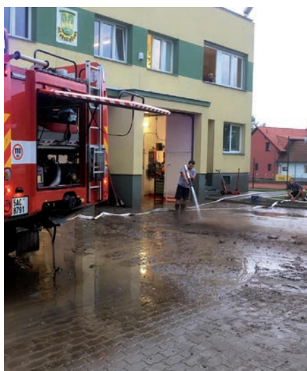
Blesková povodeň v Březiněvsi

Přivalový déšť 23. 5. 2018. Po velmi vydatném přivalovém dešti, který zasáhl severní část Prahy, především pak naši městskou část, byla naše jednotka vyslána k několika případům. Prakticky všichni naši hasiči byli v pohotovosti. V 18.29 hod. byl vyhlášen z ope-