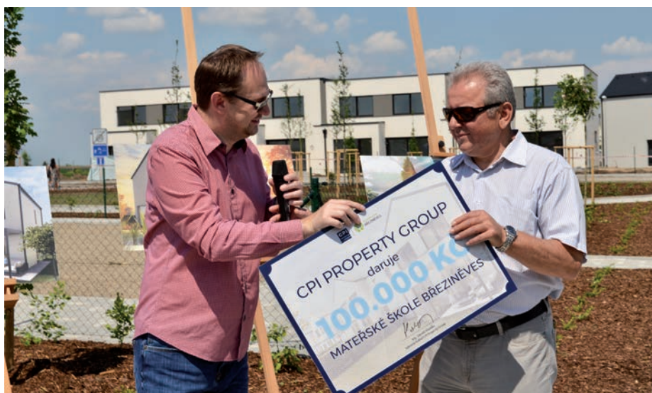
Předání šeku pro MŠ Březiněves