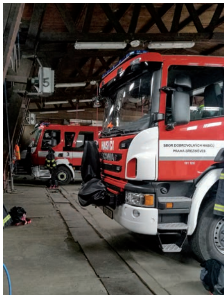
Odborná stáž na stanici HS3- Holešovice

Ve dnech 5. 5. a 11. 5. se naše jednotka zúčastnila odborných stáží u našich profesionálních kolegů na stanici HS 3 – Holešovice. Stáž trvala pokaždé 12 hodin a to od 7 do 19 hodin.