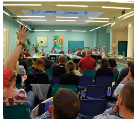
Jednání zastupitelstva bylo místy bouřlivé

Druhým problémem, se kterým se škola v Ďáblicích potýká, je dlouhodobá rekonstrukce a dostavba školy. Důvody pro rozšíření školy jsou evidentní a zcela pochopitelné, za poslední dvě dekády se totiž výrazně změnil počet obyvatel okrajových městských částí a jejich demografická struktura, což zvýšilo nároky na počet míst ve školách a školkách. Ďáblická škola se rozšiřuje v několika etapách, bohužel se ale ukazuje, že ne vždy se plánovalo jak, jak by bylo třeba. Některé nově zbudované třídy například vykazují výrazně nadlimitní úroveň hluku při výuce, který se za celý školní rok nepodařilo uspokojivě eliminovat. Stavební práce často probíhají v průběhu výuky. Kvůli postupující rekonstrukci a dostavbě se musí učitelé a žáci různě stěhovat po škole,