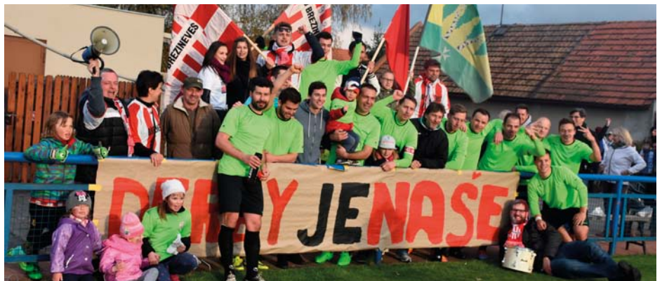
K úspěchům fotbalistů přispívá i výrazná podpora březiněveských fanoušků