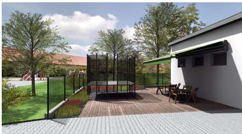
Vizualizace budoucí podoby prostoru před fitcentrem