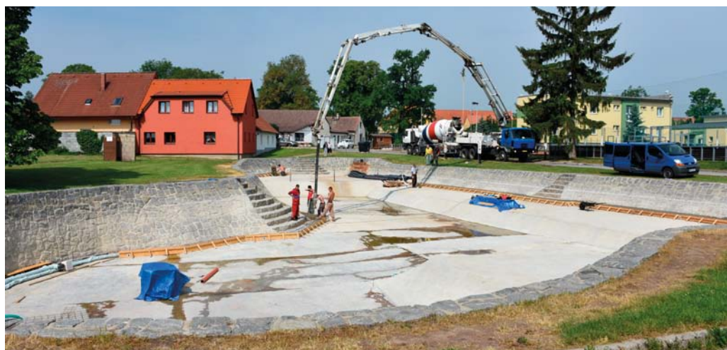
Veškeré práce proběhly tak, aby byla nádrž připravena před letní sezónou

Městské části Praha-Březiněves se podařilo v březnu tohoto roku získat z rozpočtu magistrátu hlavního města účelovou dotaci ve výši 4 miliony korun na výstavbu čističky vody pro rekreační rybník. Přesně po deseti letech tak nádrž opět doznala modernizace.