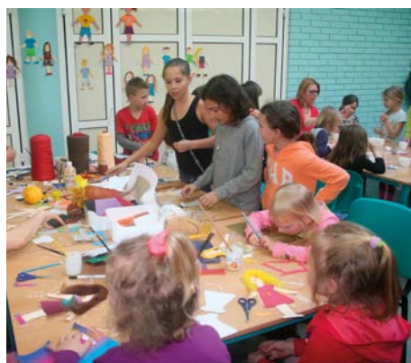
Dětské dílny v Ďáblické škole

Od letošního roku začal při Ďáblické základní škole U Parkánu aktivně působit spolek rodičů, učitelů a přátel školy – Spolek Parkán. Naším cílem je podporovat kvalitu vzdělávání v Ďáblické škole, rozvíjet spolupráci rodičů, pedagogů a občanů, podporovat znevýhodněné žáky, pomáhat uskutečňovat vizi ko-