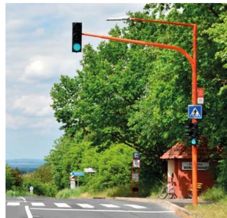
Nový semafor v Bořanovicích

Nově upravený přechod pro chodce se semafovy a průsvětlením byl uveden do provozu v květnu na silnici 243/II v sousedních Bořanovicích. Semafor má přispět k vyšší bezpečnosti chodců, zejména dětí, které v tomto velmi nepřehledném místě, schovaném směrem od Líbeznice za obzorem, přecházejí mezi autobusovými zastávkami.