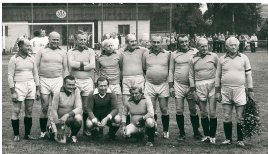
80. léta - Stará garda