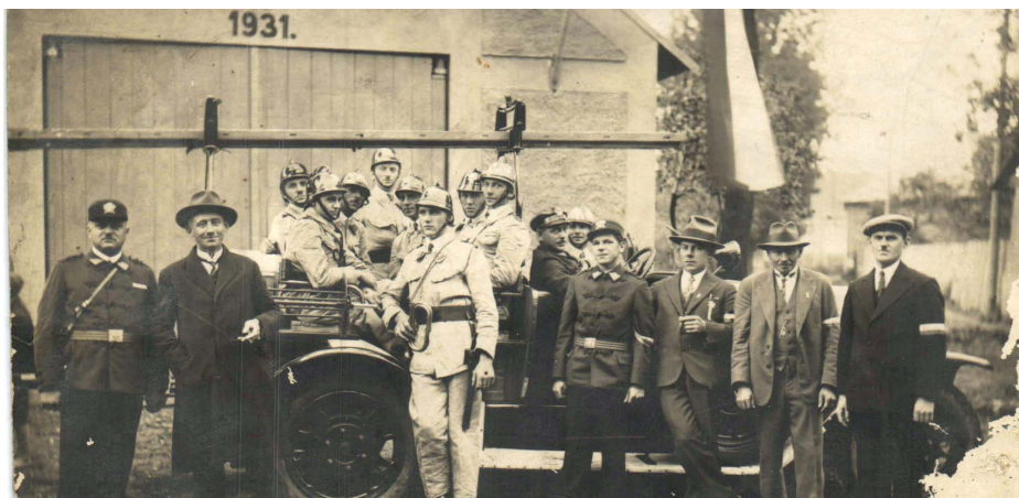
Zakládající členové sboru dobrovolných hasičů před zbrojnicí