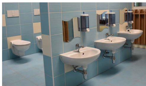
Každá třída má vlastní, barevně odlišenou koupelnu

Během jara budou rekultivovány okolní plochy, které byly výrazně zatíženy stavbou. Počítá se také s vybavením zahrady dalšími herními prvky a s přístavbou pergoly na východní straně pavilonu. Dohromady nyní celá školka pojme na 130 dětí, což by podle demografického výhledu mělo odpovídat potřebám městské části přibližně do roku 2030.