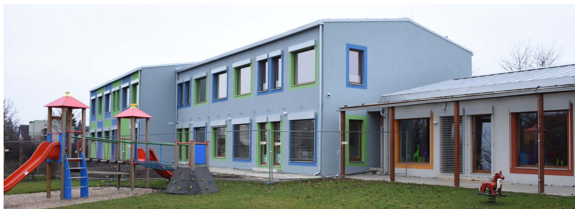
Nový pavilon se třemi třídami a kuchyní navazuje na původní část školky

V první březnový den byla pro děti otevřena nová část březiněveské školky. Ta je nyní kompletní a má dostatečnou kapacitu pro plánovaný rozvoj Březiněvsi v příštích 15 letech.