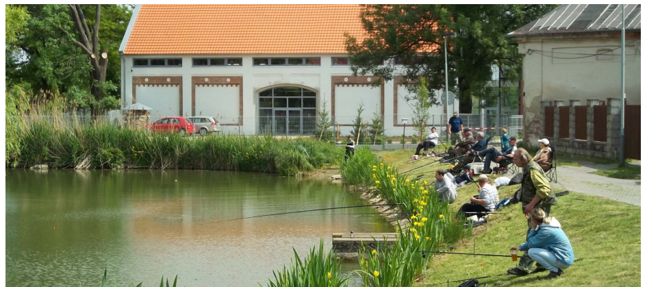
Rybářské závody na rybníku Pokorňák

Sdružení rybářů má aktuálně 29 členů, bohu-