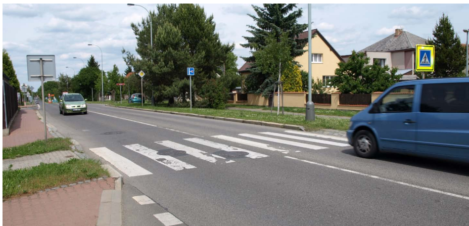
Přechod ulice Na Hlavní stále čeká na prisvětlení