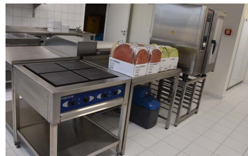
Kuchyně je vybavena moderní technologií

jednotkami pro parné letní dny. Na střeše školky budou umístěny solární panely, které pokryjí část spotřeby elektrické energie, zejména provoz kuchyně. Její vybavení je na špičkové úrovni, nechybí velký konvektomat, kapacitní varny či moderní loupáčka brambor. Kapacita kuchyně plně pokryje potřeby mateřské školy, která si dosud musela stravování zajišťovat externě.