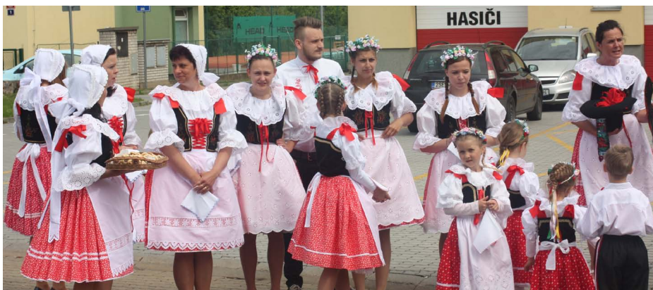
Nové kroje byly pořizeny s přispěním městské části

V letošním roce budeme již podesáté pořádat v rámci obnovených staročeských Májů „vyvádění děvčat“. Tradice se nerodila úplně jednoduše. V roce 2005 se blížilo výročí osvobození republiky a já jsem v kronice našla zmínku, že se v Březiněvsi v roce 1945 tancovala na hřišti Česká beseda. A najednou byl na světě nápad: naučit besedu naše nejmenší, u příležitosti 60. výročí osvobození republiky zorganizovat staročeské Máje a tanec předvést na veřejnosti. Poté, co jsme s jistými obtížemi sehnali správnou hudbu, jsme se pustili do nácviku. Děti se těšily, ale to ještě netušily, jak urputná práce je čekat, kolik krokových variací se budou muset naučit a kolik času budou muset výsledku obětovat. K naší velké radosti se k menším dětem postupně přidalo i pár starších, které si chtěly tanec také vyzkoušet. Takže tanečníků bylo dost, chyběly nám ale kroje, a ty jsou základem! Vypravila jsem se proto na radnici pro podporu od pana starosty a získala ji. Kroje jsme nechali ušít na zakázku podle krajových zvyklostí a dochovaných fotografií. Zajistili jsme velkou májku na náměstí a malé májky k domu každé dívky, která měla být mládencem vyvedena do společnosti. Snaha všech zúčastněných vyvrcholila vyváděním děvčat 14. května 2005. Ve večerních hodinách pak byla v sále hostince Pod Lipami předvedena dvě kola České besedy (nejmladší a -náctiletí). Máme radost, že se tradice udržela do dnešních dnů, byť je stále co zlepšovat. V loňském