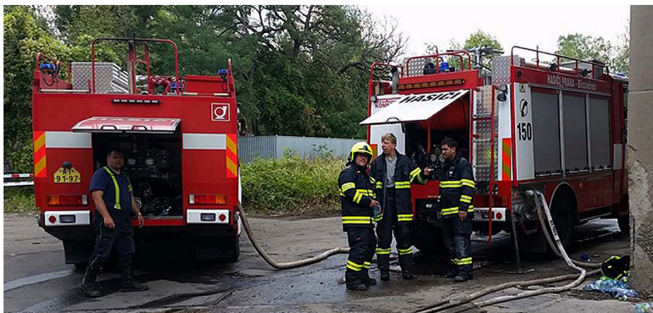
Březiněveská jednotka zasahuje při požáru skladu ve Vysočanech