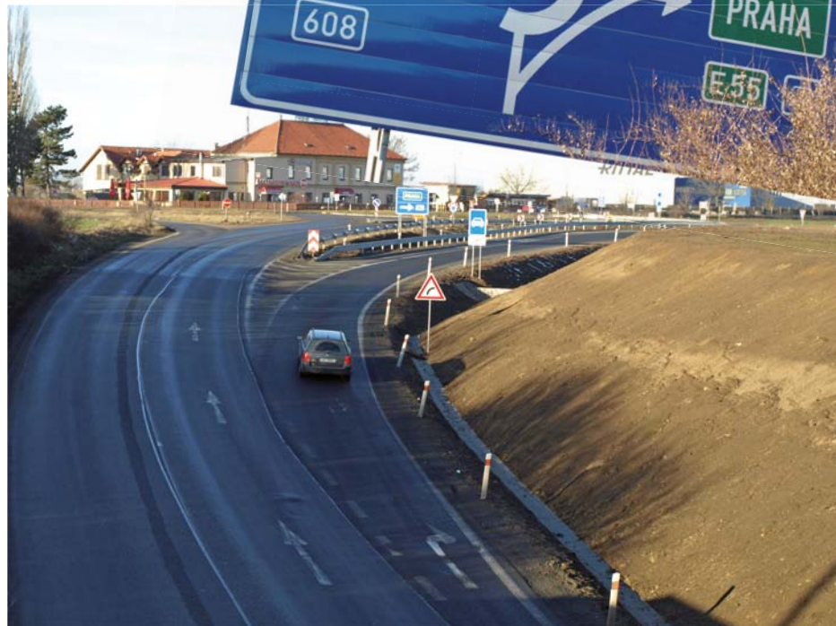
Nový by-pass kruhového objezdu na křižovatce u Zbíb