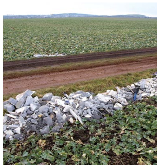
Tato černá skládka se objevila v polovině února na polní cestě mezi Brezinevsi a Hovorčovicemi

Co vzkázat zakladateli skládky? Ve správním řízení můžete dostat pokutu až 50 tisíc korun a skládku budete muset na vlastní náklady odstranit. Ať už jste odkudkoliv, nebudte příště hloupý, neničte tlumiče auta na rozbité polní cestě a zajedte do vašeho sběrného dvora. Tam od vás suť z domácí rekonstrukce ZDARMA odeberou. Budete mít klid a dobrý pocit.