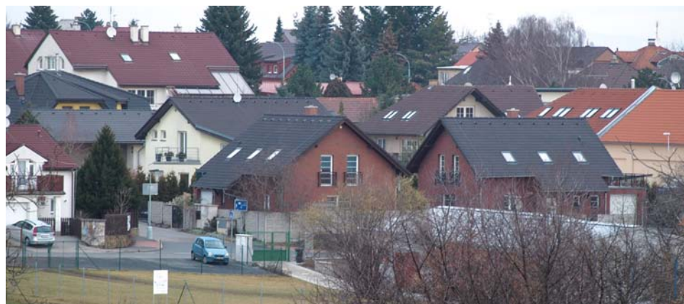
Majitelé nemovitostí by neměli brát změny v občanském zákoníku na lehkou váhu