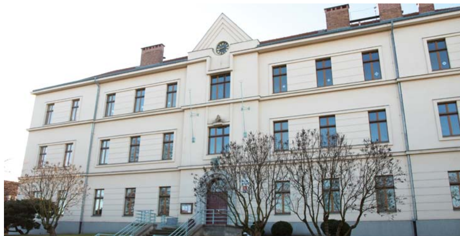
Základní škola v Ďáblicích se potýká s nedostatkem míst pro nové žáky

Situace je však ovlivněna ještě dalšími faktory. Jedním z nich je počet žáků, kteří se z pátých