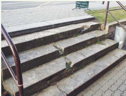
Schodiště v únoru, březnu a dubnu

Schodiště spojující autobusovou zastávku se vstupem do restaurace a obchodu se po poslední zimě ocitlo v havarijním stavu. Rozbité stupně mohly být zejména pro starší chodce potenciálně nebezpečné, proto bylo třeba přistoupit k rychlé rekonstrukci. Ta zahrnovala vybudování nových železobetonových základů, instalaci nových stupňů a obrubníků. Vedle toho bylo vyměněno i nevyhovující zábradlí. -red-