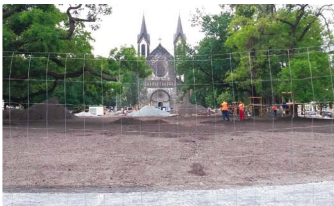
Park je v současnosti pro veřejnost uzavřen

Hlavní karlínské náměstí, kterému dominuje kostel svatého Cyrila a Metoděje, se po dlouhých letech chátrání konečně dočkalo rekonstrukce. Ta začala v březnu a dotkne se postupně celé plochy parku na náměstí. Nejprve byly vykáceny dřeviny, z nichž řada byla nemocná a svému okolí nebezpečná. Všechny vykácené stromy budou nahrazeny novými. Nyní přichází na řadu rozebrání všech komunikací v parku, demolice budovy technického zázemí a rekonstrukce kašny. Kompletní proměny a mo-