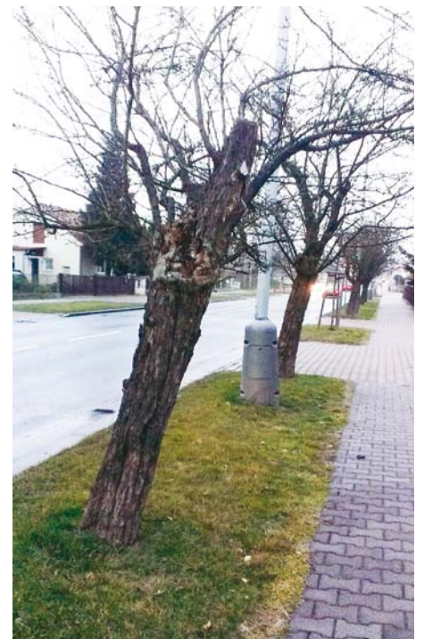
Stav hlohů byl tristní