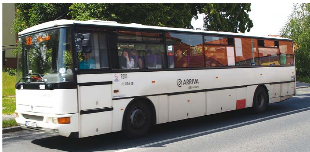
Regionální linka 348 na trase Libiš - Ládví

Jak si obyvatelé Březiněvsi využívající hromadnou dopravu jistě všimli, od začátku dubna výrazně přibýlo regionálních „modrých“ autobusů, které zastavují v naší městské části. V ranní špičce v Březiněvsi co pět minut staví některý z autobusů 348, 368 nebo 369, jedoucích na Ládví.