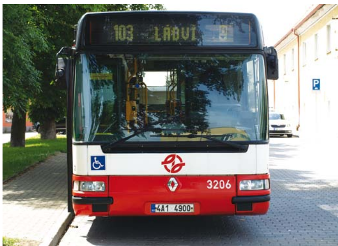
Autobus 103 na konečné v Březiněvsi