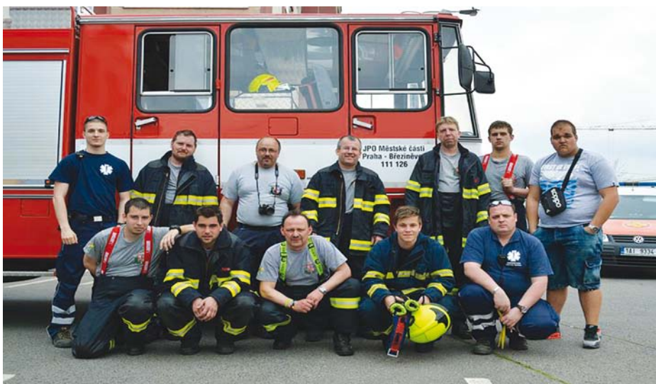
Tým březiněveských hasičů