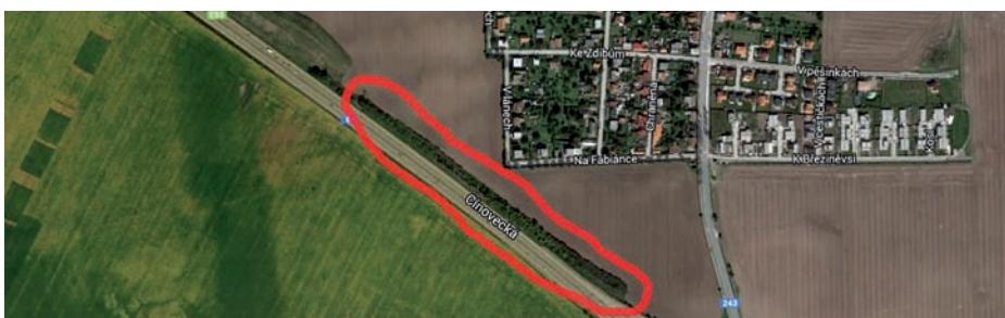
Letecký snímek Cínovecké s vyznačením místa budoucího valu