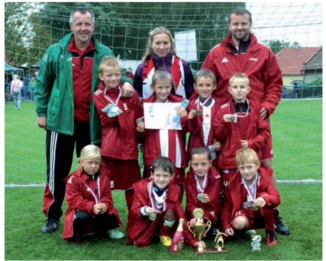
Mladší příprava 2007