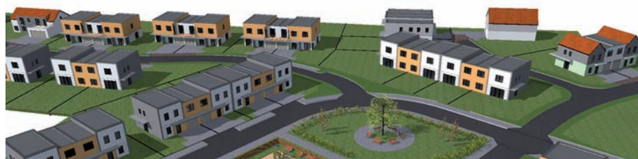
Vizualizace části nové výstavby