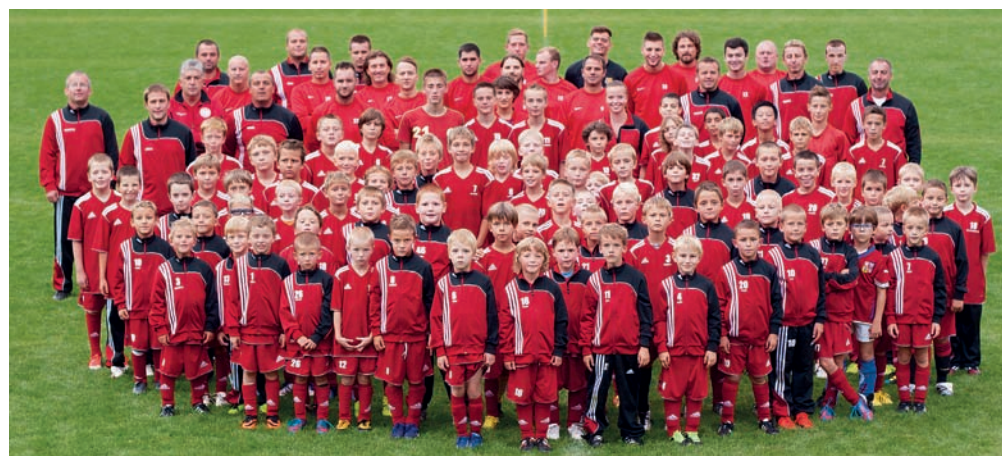
Fotbalová mládež a realizační tým

V polovině září uplyne přesně pět let od chvíle, kdy na trávník tělovýchovné jednoty vyběhla pod vedením několika trenérů z řad tatínků-naděnců a za podpory městské části hrstka březiněveských dětí a po čtvrtstoletí tak vznikla mládežnickou kopanou v Březiněvsi.