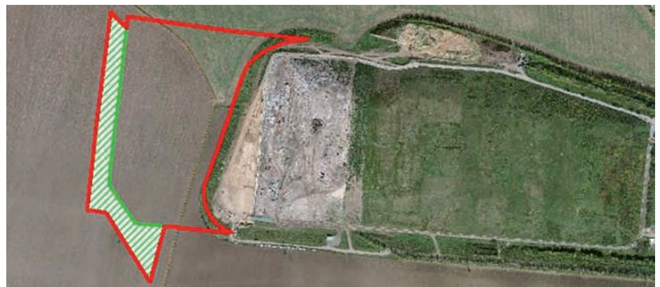
Letecký snímek řáblické skládky s vyznačením jejího možného rozšíření