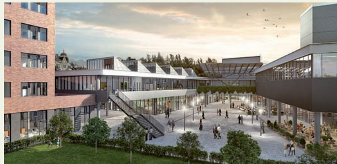
Vizualizace Nové Palmovky