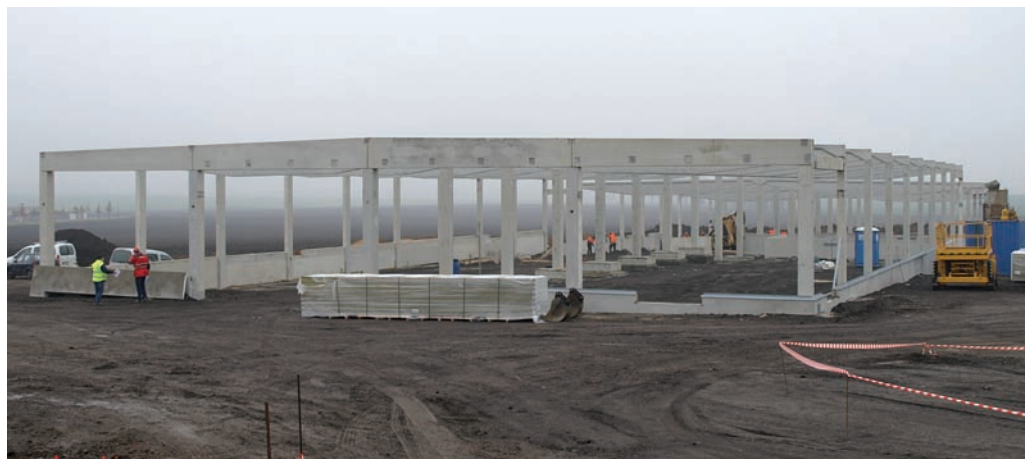
Obchodní centrum Březiněves šest týdnů po zahájení stavby

Jak si většina občanů již jistě všimla, v polovině října byla v těsné blízkosti Březiněvsi výkopovými pracemi zahájena výstavba nového nákupního centra. Stavba by měla být dokončena již na jaře příštího roku.