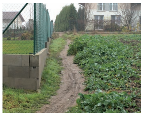
Cesta k bořanovickému háji