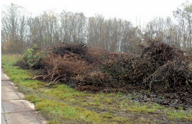
Větve z prořezů patří na haldu za koupaliště