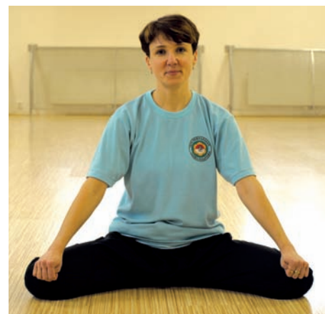
Cvičení Satria Nusantara

Nově budou probíhat také setkání rodičů, kterým není lhostejné stravování jejich dětí. Půjde o sezení s povídáním o pravidlech zdravé výživy, důraz bude kladen na názorné ukázky přípravy zdravého jídla. Všichni zúčastnění se do přípravy zapojí, budou moci ochutnat a podělit se o vlastní zkušenosti. První setká-