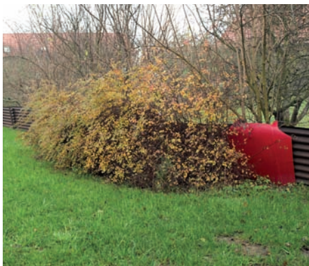
Nevyhovující plot u MŠ