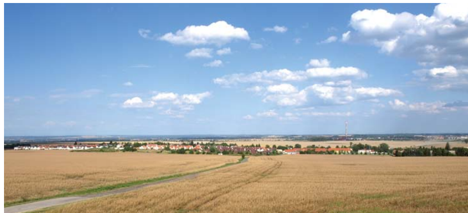
Pohled na Březiněves od dálnice D8

V posledních měsících se kauza kolem březiněveských restitucí dostala na titulní strany novin a do reportáží otevírajících večerní televizní zpravodajství. Média referují o prozatím největším restitučním sporu, ve kterém jde o miliardový majetek.