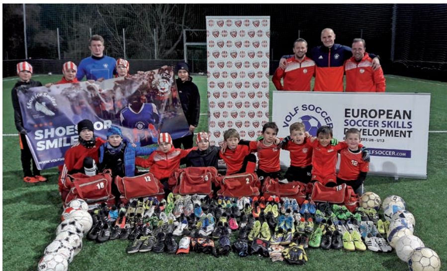
Sbírka kopaček pro kluky z Ugandy