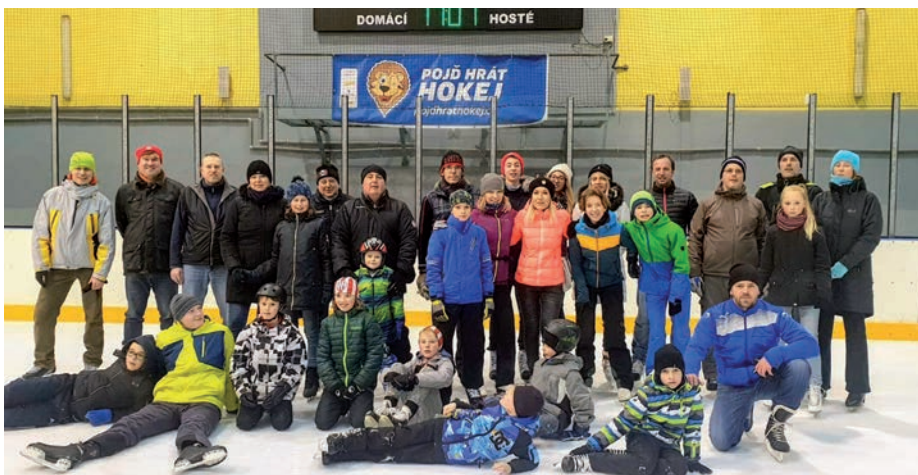
Břízka na ledě