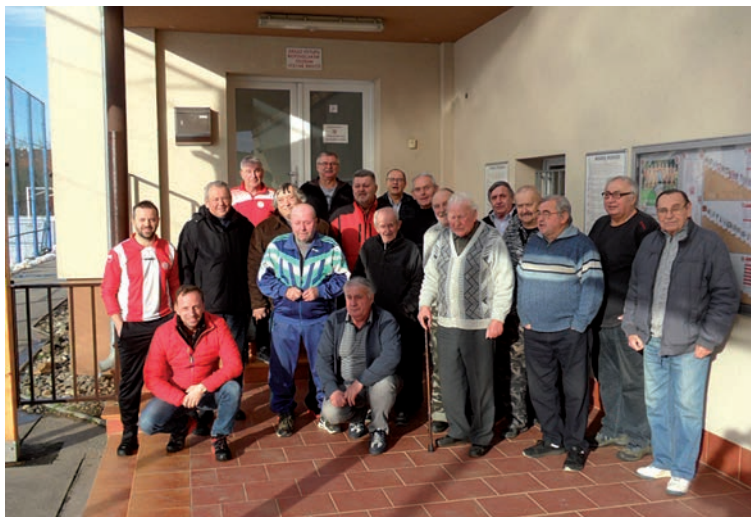
Setkání čestných členů TJ Březiněves