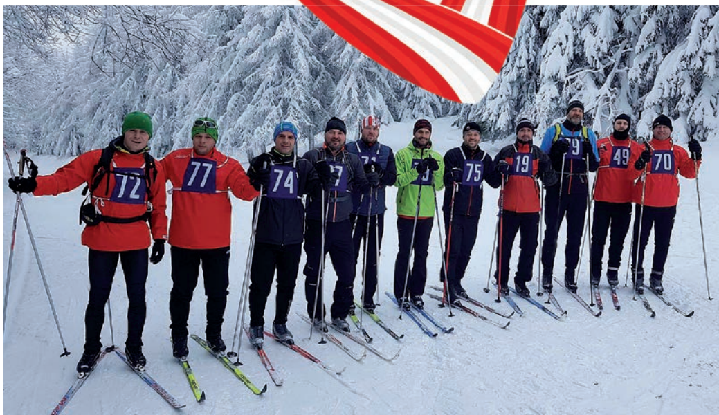
Gentlemani na soustředění

A č se zdá, že zimní období nepřije fotbalu, je tomu právě naopak. Všechny naše kategorie se v zimě velmi pečlivě připravují na jarní sezonu. Starší příprava 2009 odehrála zimní ligu v Kolovratech, mladší žáci, starší příprava 2008 a mladší příprava 2010/11 strávili zimu na zimní lize v Holešovicích na Lokádě. Kategorie 2010/11 hraje kromě zimní ligy také mnoho turnajů. Ani nejmenší kluci nezhálejí a vedle tréninkového procesu v tělocvičně hrají pravidelně turnaje v Mělníku. A-tým se umístil v zimní lize v Kyjích na 5. místě. Běčko k tréninkovému procesu přidalo v zimě dva přáteláky a další jej čekají před začátkem sezóny. Na zimní soustředění se vydaly dva týmy mužů. Jako první vyjeli Gentlemani do Beskyd na běžky a v únoru jelo na čtyřdenní soustředění vyladit formu naše Áčko na Statek Bernard.