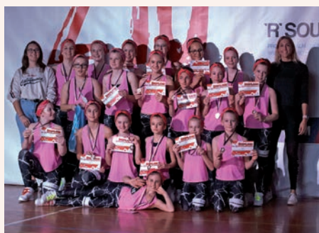
Závodní Zumba tým TJ Březiněves