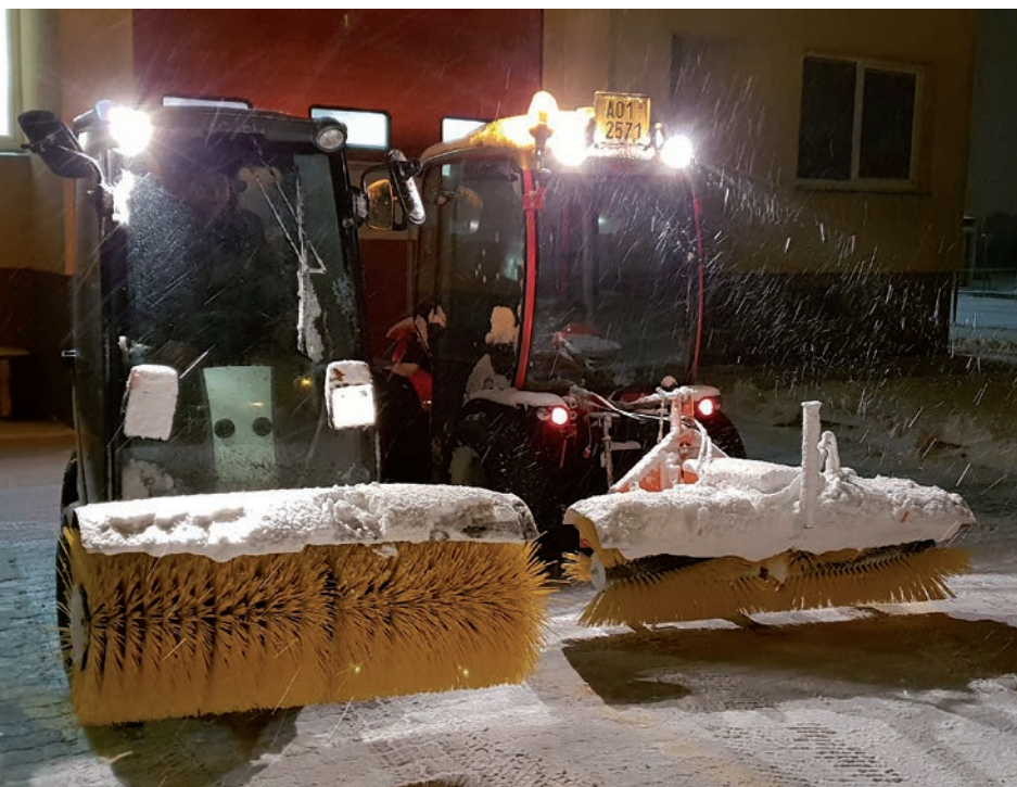
Stroje Egholm a Antonio Carraro při odklízení sněhu v akci

byly následně dočištěny a ošetřeny chemickým posypem díky smlouvě uzavřené se společností IPODEC (řidič Antonín Vilím). Sníh byl mokrá a těžký a úklid nebyl jednoduchý. Proto bychom rádi poděkovali všem, kteří si před svým domem uklízeli sami, a nám tak pomohli zlepšit a hlavně zrychlit celkový úklid Březiněvsi. Na tomto místě bych chtěl apelovat na ty řidiče, kteří parkují vozidla před domem tak, že zasahují do chodníků, aby se při podobných situacích, které jsou