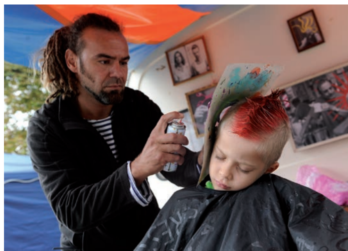
Bejbypunkový holič v akci se nezastavil po celou dobu festivalu