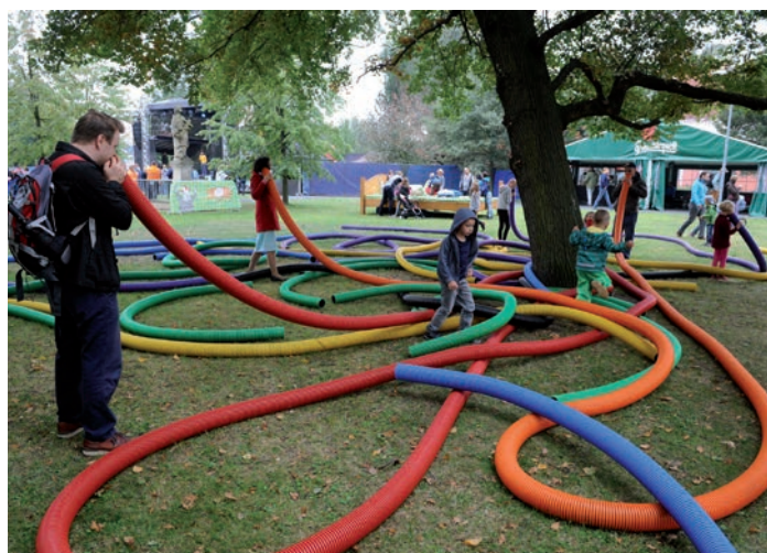
Kašpárkovy atrakce nenechaly klidným ani jedno dítě