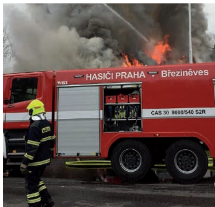
Likvidace požáru u Hlavence