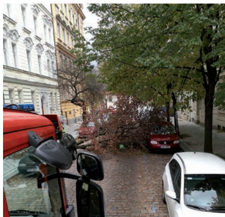
Spoušť po orkánu Herwart