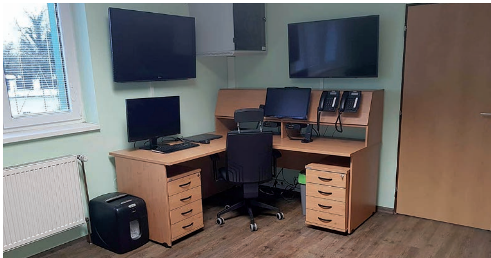
Zázemí Dobrovolného sboru hasičů MČ Praha-Březiněves prošlo rekonstrukcí