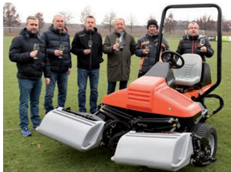
Slavnostní předání vřetenové sekačky oddílu TJ Březiněves

Počet členů TJ je v současné době nejvyšším v historii. Pokračující trend v nárůstu členské základny svědčí o dobře odváděné práci