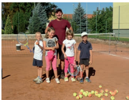
Tenisový oddíl se koncentruje především na práci s mládeží

V letošním roce se aktivity oddílu tenisu soustředily zejména na práci v oblasti dětí a mládeže. Aktuálně máme v oddíle na 35 dětí