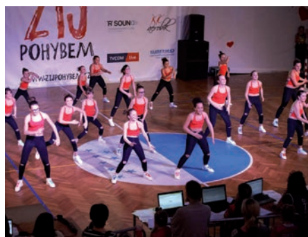
Naše zumbistky v akci

V letošním roce se březiněveský Zumba team zúčastnil čtyř kol soutěže nazvané Žij pohybem. Pod vedením Veroniky Pechové