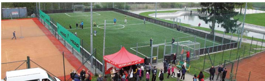
Sportovní areál v Březiněvsi

ty s PU antukou, hřiště na plážový volejbal a fitcentrum se dvěma sály. Tenisový areál je ve správě Tenisového oddílu TJ Březiněves, přístup na kurty pro nečleny oddílu zajišťuje recepce fitcentra. Ostatní hřiště (kopaná, nohejbal, beach volejbal) lze objednávat u správce areálu Josefa Korinta na telefonnu 777 824 152. Ceník sportovišť naleznete přímo v rezervačním systému či na vývěskách v areálu. Otevírací doba je většinou od 7 do 21 hodin.