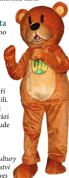
Komise kultury a školství MČ Praha-Březiněves

BŘENDA, to je jméno nového březiněveského maskota, které jste vybrali v rámci internetového hlasování na stránkách městské části. Děkujeme všem, kteří se hlasování zúčastnili. Méda Břenda nás již několik měsíců provází na většině akcí - a bude tomu tak i nadále.