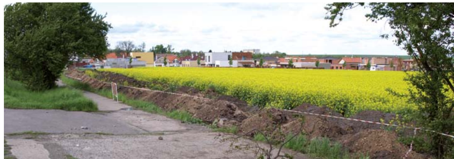
Na tomto místě bude vybudována nová křižovatka