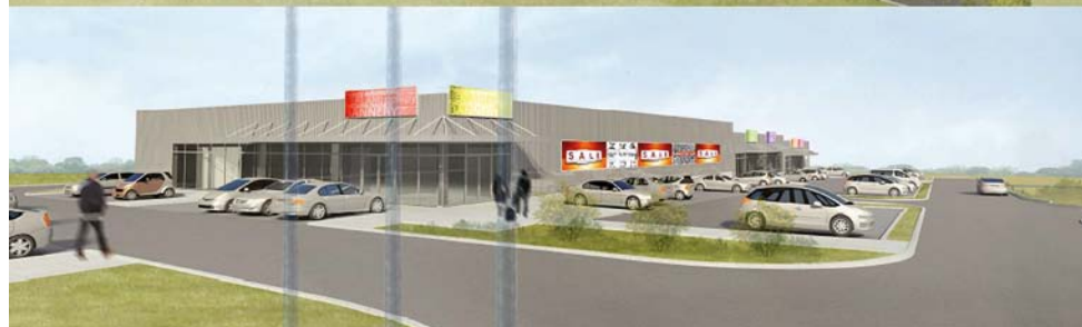
Vizualizace Obchodního centra Březiněves