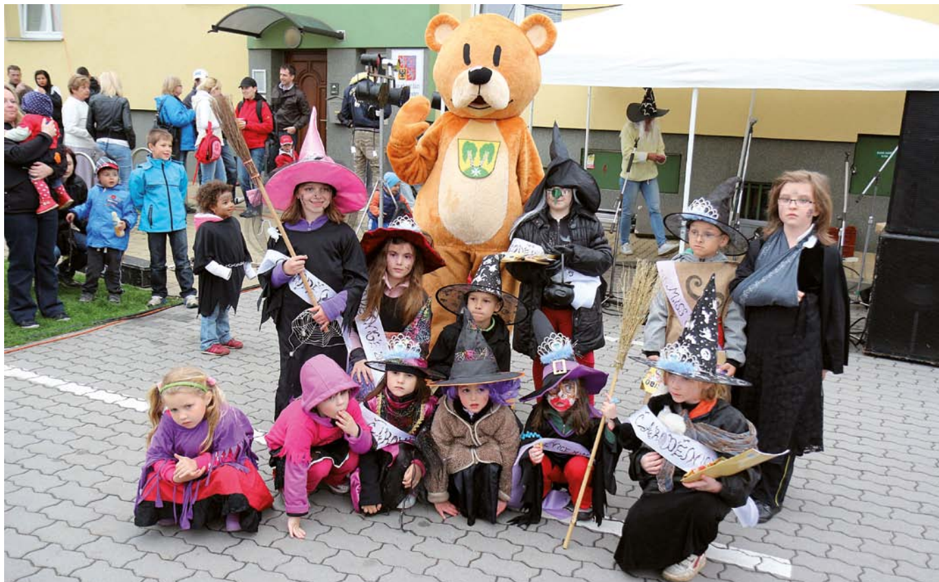
Malé čarodějnice pózuji s maskotem Břendou