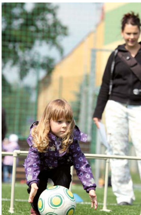
Dětský den 2012