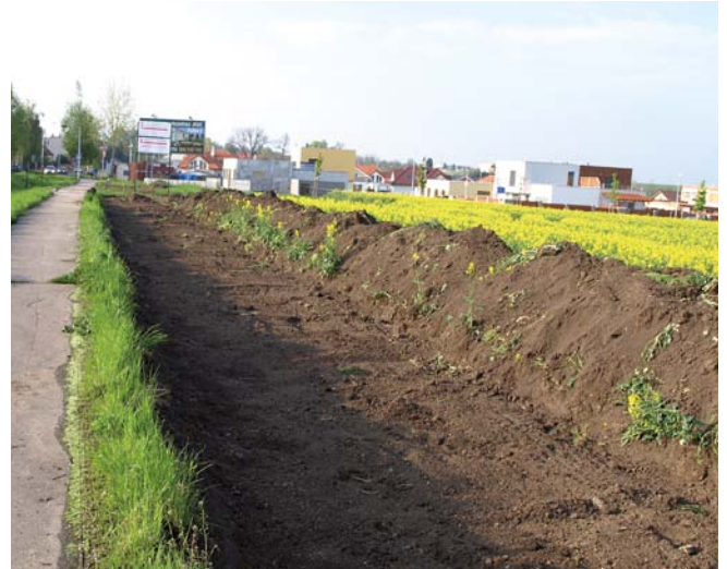
Výkopové práce před Březiněvsi